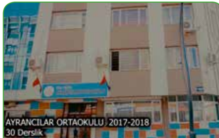
AYRANCILAR ORTAOKULU 2017-2018 30 Derslik