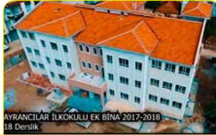
AYRANCILAR İLKOKULU EK BİNA 2017-2018 18 Derslik