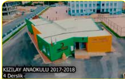
KIZILAY ANAOKULU 2017-2018 4 Derslik