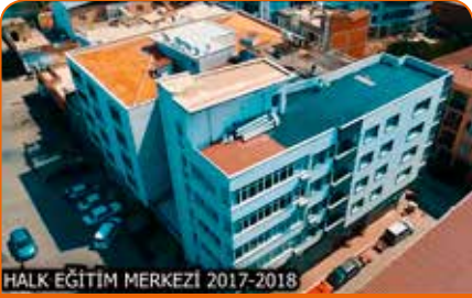
HALK EĞİTİM MERKEZİ 2017-2018