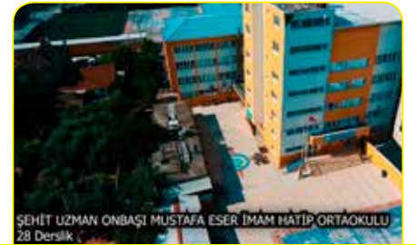
ŞEHİT UZMAN ONBAŞI MUSTAFA ESER İMAM HATİP ORTAOKULU 28 Derslik