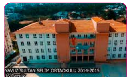
YAVUZ SULTAN SELİM ORTAOKULU 2014-2015 16 Derslik