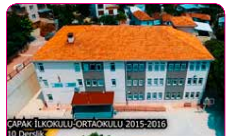
ÇAPAK İLKOKULU-ORTAOKULU 2015-2016 10 Derslik