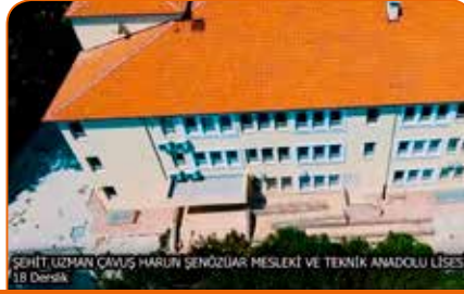
ŞEHİT UZMAN ÇAVUŞ HARUN ŞENOZUAR MESLEKİ VE TEKNİK ANADOLU LİSESİ 18 Derslik