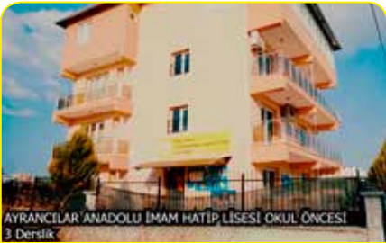
AYRANCILAR ANADOLU İMAM HATİP LİSESİ OKUL ÖNCESİ 3 Derslik