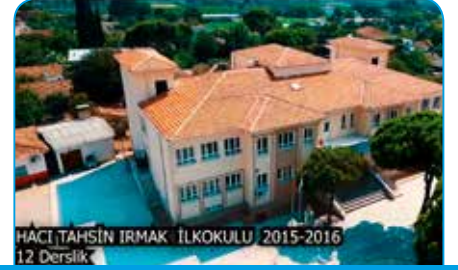
HACI TAHSİN IRMAK İLKOKULU 2015-2016 12 Derslik