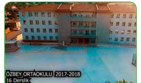
ÖZBEY ORTAOKULU 2017-2018 16 Derslik