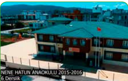
NENE HATUN ANAOKULU 2015-2016 6 Derslik