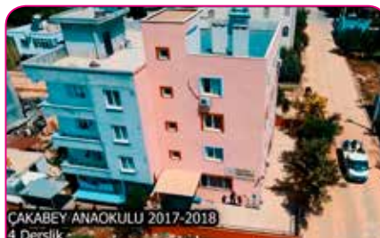
ÇAKABEY ANAOKULU 2017-2018 4 Derslik