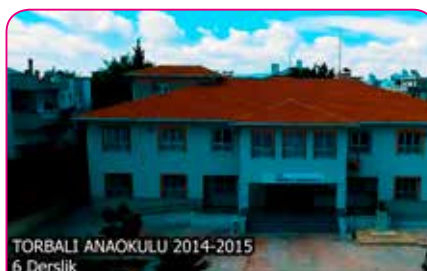
TORBALI ANAOKULU 2014-2015 6 Derslik