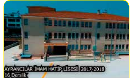
AYRANCILAR İMAM HATİP LİSESİ 2017-2018 16 Derslik