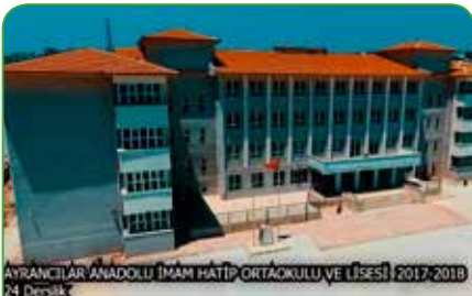
AYRANCILAR ANADOLU İMAM HATİP ORTAOKULU VE LİSESİ 2017-2018 24 Derslik