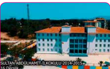
SULTAN ABDÜLHAMİT İLKOKULU 2014-2015 16 Derslik