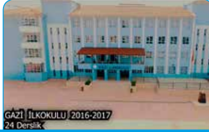
GAZİ İLKOKULU 2016-2017 24 Derslik