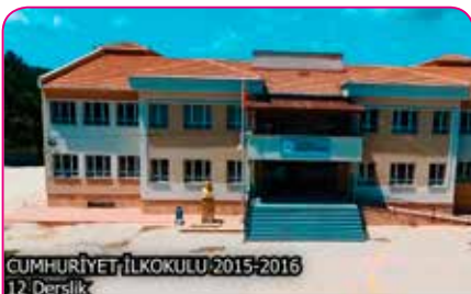
CUMHURİYET İLKOKULU 2015-2016 12 Derslik