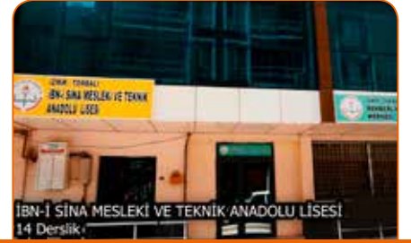
İBN-İ SİNA MESLEKİ VE TEKNİK ANADOLU LİSESİ 14 Derslik