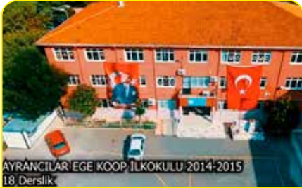
AYRANCILAR EGE KOOP İLKOKULU 2014-2015 18 Derslik

Şehit Onur Ensar Ayanoğlu Ortaokulu, Torbalı Ayrancılar İmam-Hatip Ortaokulu, Gazi İlkokulu, Özbey Ortaokulu, Torbalı Mesleki ve Teknik Anadolu Lisesi ek binası, Ayrancılar Anadolu İmam-Hatip lisesi, Kızılay Anaokulu, Ayrancılar İlkokulu ek binası, Cengiz Topel Anaokulu Berfin Akçokrak Anaokulu, Hasan Salih Çetinel Ortaokulu, Ayrancılar Anadolu Lisesi (yapım aşamasında), Tepeköy ilk/ ortaokulu (yapım aşamasında), Anadolu İmam-Hatip Lisesi (yapım aşamasında), Fatih İlkokulu-Ortaokulu (yapım aşamasında), Torbalı Anadolu Lisesi (yapım aşamasında), Dünya Bankası Avrupa Birliği İlkokulu (yapım aşamasında).