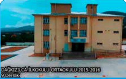
DAĞKIZILCA İLKOKULU-ORTAOKULU 2015-2016 9 Derslik